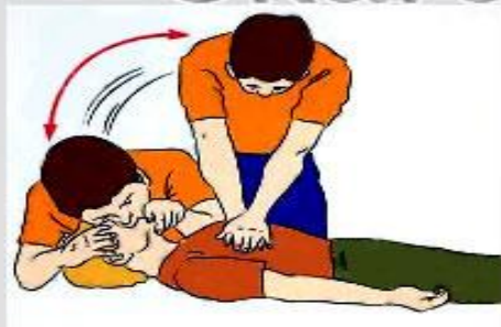
4. Если пульс, дыхание и реакция зрачков на свет отсутствуют - немедленно приступайте к сердечно-легочной реанимации