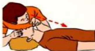
2. Прислушайтесь к дыханию, установите наличие или отсутствие движений грудной клетки