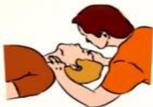
1. Определите наличие пульса на сонной артерии

• Пульс и сердцебиение: они могут хорошо прослушиваться, быть учащенными, аритмичными или ослабленными. Но только если они не определяются вообще, можно делать непрямой массаж сердца .