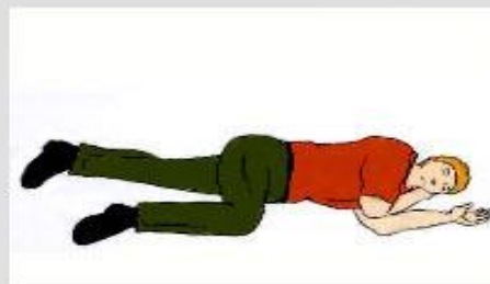
5. При восстановлении самостоятельного дыхания и сердцебиения придайте больному устойчивое боковое положение

Оцените состояние больного и определите необходимость сердечно-легочной реанимации