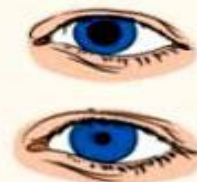
3. Определите реакцию зрачков на свет, приподнимая верхнее веко обоих глаз